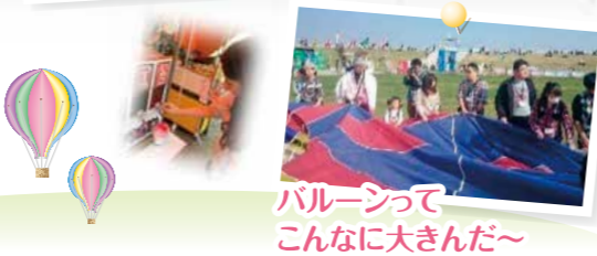
バルーンってこんなに大きんだ~