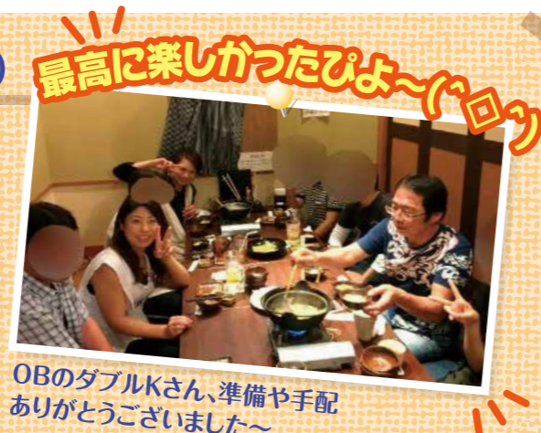
OBのダブルKさん、準備や手配ありがとうございました~